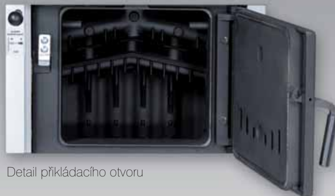
Detail příkládacího otvoru