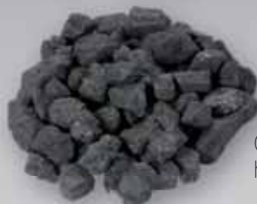
Černé uhlí hrášek