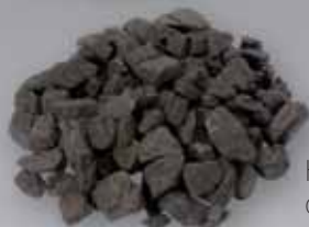
Hnědé uhlí ořech 2