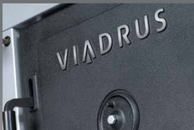
Detail příkládacích dvířek